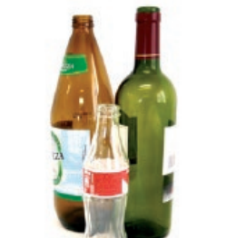
Beirazko botilak / Botellas de vidrio

EL RESTO AL CONTENEDOR GRIS EREFUSA EDUKIONTZI GRISERA