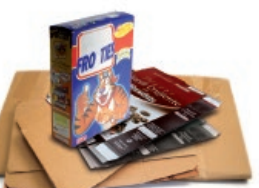
Kartoizko kaxak eta ontziak / Cajas y envases de cartón

Recicla el papel y cartón bien plegado y sin bolsas de plástico Birziklatu papera eta kartoia, ongi tolestuta eta plastikozko poltsarik gabe