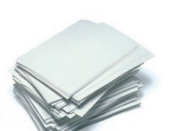
Paperezko orriak / Hojas de papel