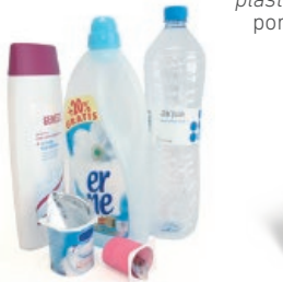
Plastikozko ontziak / Envases de plástico