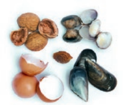
Arrautza eta marisko oskolak, fruitu lehorrak / Cáscaras de huevo, frutos secos y marisco