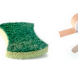
Espartzua / Estropajo