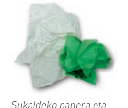
Sukaldeko papera eta musuzapiak / Papel de cocina y servilletas