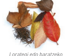
Lorategi edo baratzeko hondarrak / Restos del jardín o de la huerta

LOS ENVASES AL CONTENEDOR AMARILLO ONTZI ARINAK EDUKIONTZI HORIRA