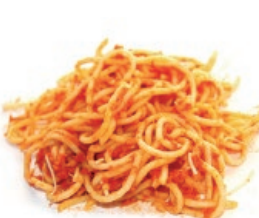
Sukaldatutako janaria (pasta, arroza, ...) / Comida cocinada (pasta, arroz...)