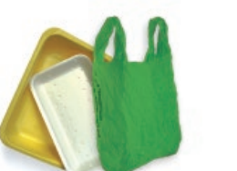
Porexpanezko erretiluak eta plastikozko poltsak / Bandejas de porexpan y bolsas de plástico