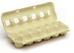
Kartoizko arrautza-ontziak / Hueveras de cartón

EL VIDRIO AL CONTENEDOR VERDE BEIRA EDUKIONTZI BERDERA