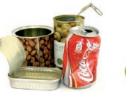
Latak / Latas

Recicla los envases quitándoles el aire para reducir el volumen Birziklatu ontziak, airea kenduta, bolumena txikitzeko