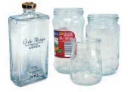
Beirazko ontziak / Tarros de vidrio

Recicla el vidrio sin tapas ni tapones Birziklatu beira, tapa eta tapoirik gabe