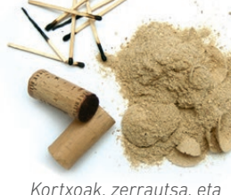
Kortxoak, zerrautsa, eta pospoloak / Corchos, serrín y cerillas