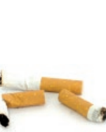
Zigarrokinak / Colillas de cigarros