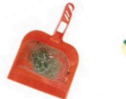
Errazte-hondarrak / Restos de barrido