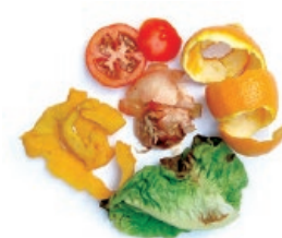
Barazki eta fruta hondarrak / Restos de fruta y verdura

Recicla la orgánica usando siempre bolsas compostables Birziklatu organikoa, beti poltsa konpostagarriak erabiliz