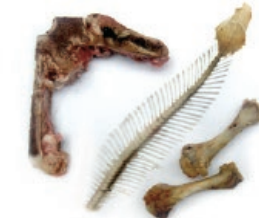
Haragi eta arrai hondarrak / Restos de carne y pescado