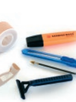
Besteak / Otros