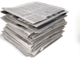
Egunkariak eta aldizkariak / Periódicos y revistas