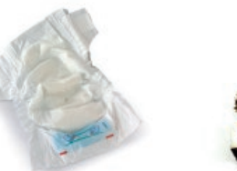
Pixoihalak eta konpresak / Pañales y compresas