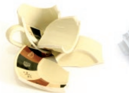
Zeramika hondarrak / Restos de cerámica

Productos que no se pueden reciclar Birziklatu ezin diren produktuak