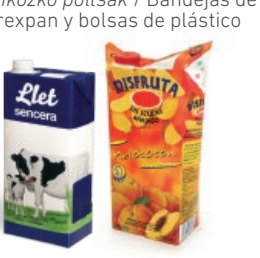
Brikak / Bricks

EL PAPEL Y CARTÓN AL CONTENEDOR AZUL PAPERA ETA KARTOIA EDUKIONTZI URDINERA